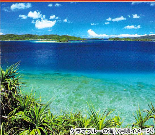
ケラマブルーの海(7月頃イメージ)