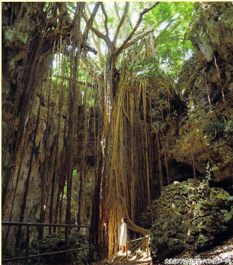
大木(カアシ)ガジュマル(イメージ)

亜熱帯の豊かな自然が息つき、谷内には川が流れ、生活に適した洞窟が点在しており、20,000年前の日本人のルーツに触れられるかもしれません。