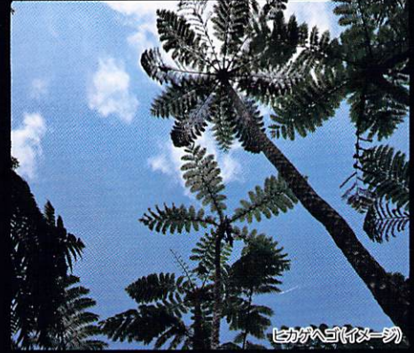
ヒカゲゴケ(イメージ)

沖縄は照葉樹などの常緑樹が多く、1年を通して緑を楽しめます。濃い緑色と明るい緑色がつむぎ上げるやんばるの森の景色は、生命の息吹に満たされ、活き活きとしたエネルギーがあふれだします。