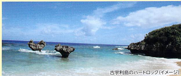
古宇利島のハートロック(イメージ)

アダムとイブの物語を思い出させる不思議な伝説が残るこの地は「恋島(くいじま)」とも呼ばれている「古宇利(こうり)島」。長年の波の侵食によりハート形に削られたロマンティックなハートロックが寄り添うように並んでいます。