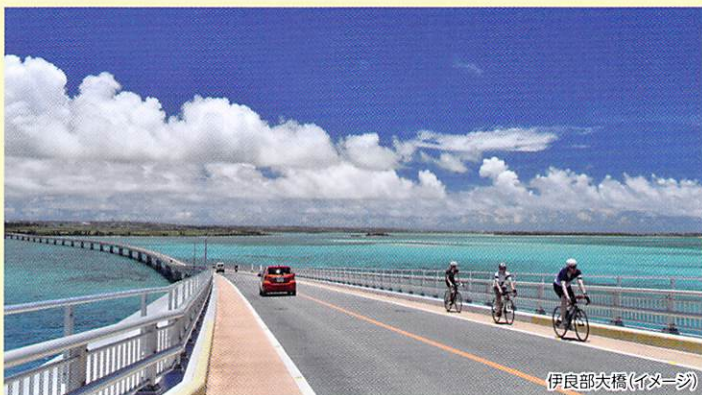
伊良部大橋(イメージ)

伊良部大橋は宮古島と伊良部島とを結ぶ無料で渡れる日本一長い橋。宮古ブルーと称される東洋でも有数の美しさを誇る透明度の高い海の上をドライブすることができます。