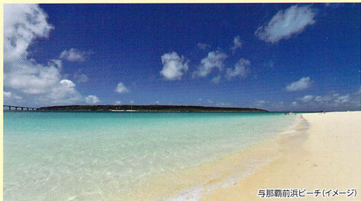
与那覇前浜ビーチ(イメージ)

宮古島を代表するビーチのひとつ。透明度の高い宮古ブルーの海と約7キロにも及ぶ白い砂浜は東洋一之美しさと言われています。