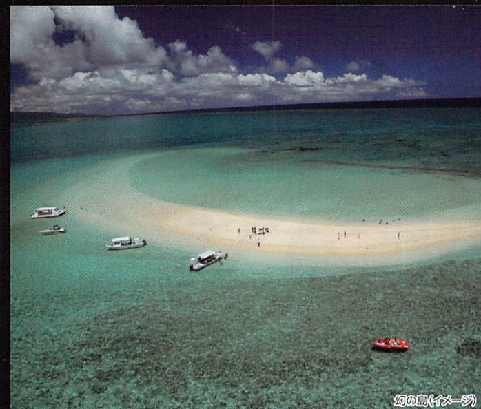
幻の島(イマージュ)

小浜島と竹富島の間に浮かぶ三日月型の無人島。潮が引いているときにだけ姿を見せることから「幻の島」と呼ばれています。島を歩いていると、まるで海の上を歩いているような気分を味わえます。