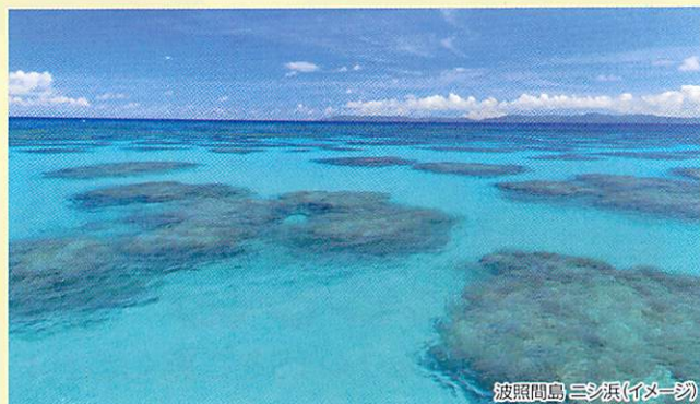
波照間島(はてるまじま)三ツ浜(イメージ)

MAPCODE 366 003 060*41 ※上記は石垣港駐車場のマップコードになります。