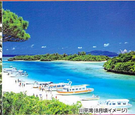
川平湾(8月頃イメージ)