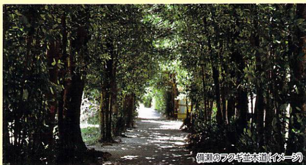
備瀬のフクギ並木道(イメージ)

古くから防風林として活用されたフクギ並木のトンネルを抜けると沖縄のコバルトブルーの海が待っています。