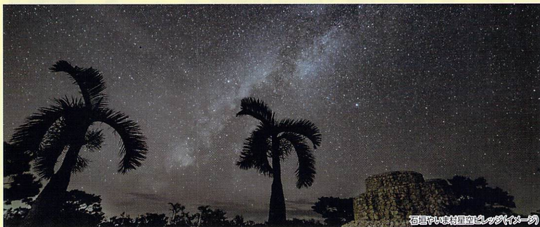
石垣やいま村星空ビレッジ(イメージ)

88ある星座の内、84の星座を観測できる石垣島。本州では見ることができない南十字星も観測できる石垣島ならではの美しい星空の下で、すてきな一夜をお過ごしください。