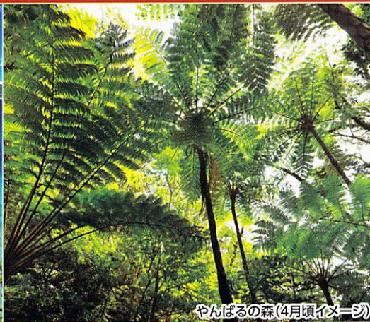
やんばるの森(4月頃イメージ)