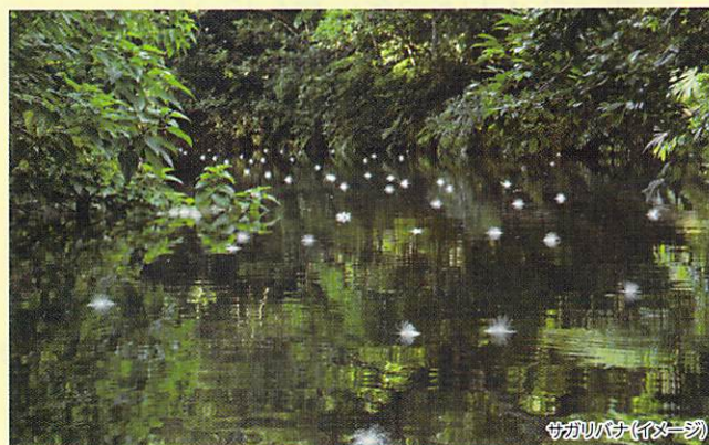
サガリバナ(イメージ)

夜の間に咲き、明け方に散っていく一夜限りのはかない花「サガリバナ」。早朝、西表島の浦内川では水面に花の絨毯が広がります。