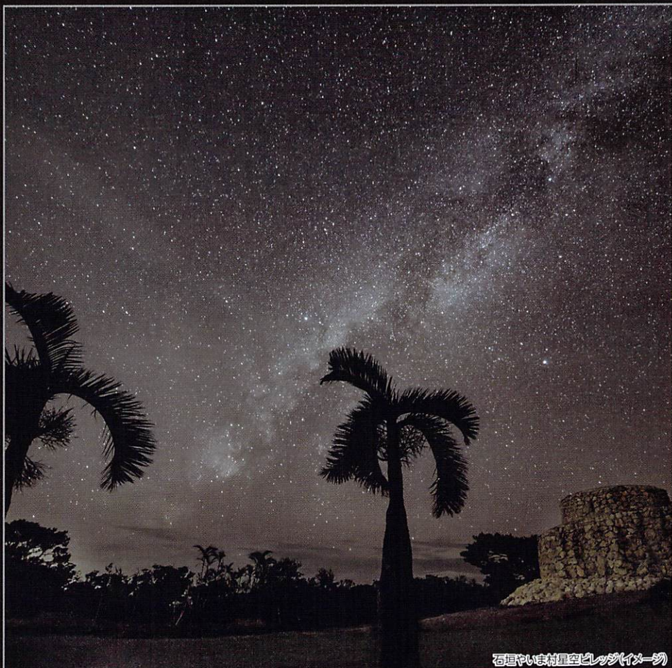
石垣やいま村星空ピレージ(イマージュ)