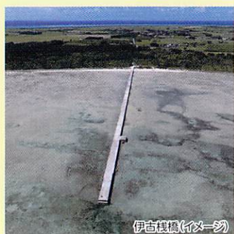
伊古棧橋(イメージ)

オプションプラン 「とかしきアイランドリゾートin慶良間」 P.30 MAPCODE 331 872 78*80 ※上記は那覇泊港駐車場のマップコードになります。