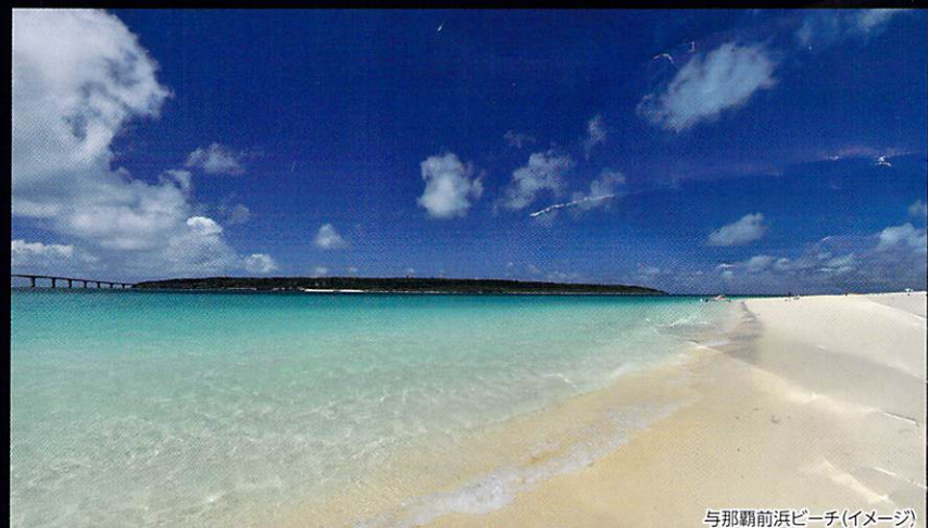
与那覇前浜ビーチ(イメージ)

■時期:通年 ■時間:日中 ■交通:那覇空港から車で約30分 ■おすすめの宿泊地:沖縄本島 南部