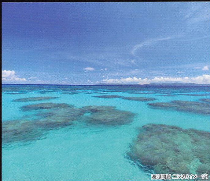
波照間島(はてるまじま)

日本一美しいビーチと呼ばれる波照間の「ニシ浜」。ここでしか見られない宝石のように美しい海は透き通った海の碧さから「ハテルマブルー」と呼ばれており、今までに見たことのない海が待ち受けております。