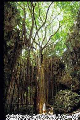
大谷(カブツシヨ)ガシマカ(イメージ)

■時期:3月~4月 ■時間:日中 ■交通:那覇空港から車で約120分(沖縄自動車道利用) ■おすすめの宿泊地:沖縄本島 北部