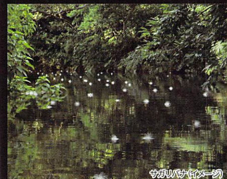
サガリバナ(イマージュ)

夜の間に咲き、明け方に散っていく一夜限りのはかない花「サガリバナ」。早朝、西表島の浦内川では水面に花の絨毯が広がります。